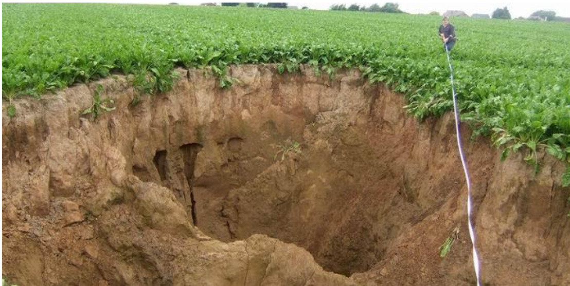
Figure 1 Trou apparu en juillet 2008 derrière le moulin de Pousset à 2 kms du parc éolien.

Des affaissements de terrain pourraient aussi endommager la ligne électrique vers Fooz et dans ce cas provoquer des courts-circuits francs à 15.000 volts et éventuellement induire des incendies (dans ou en dehors des éoliennes).