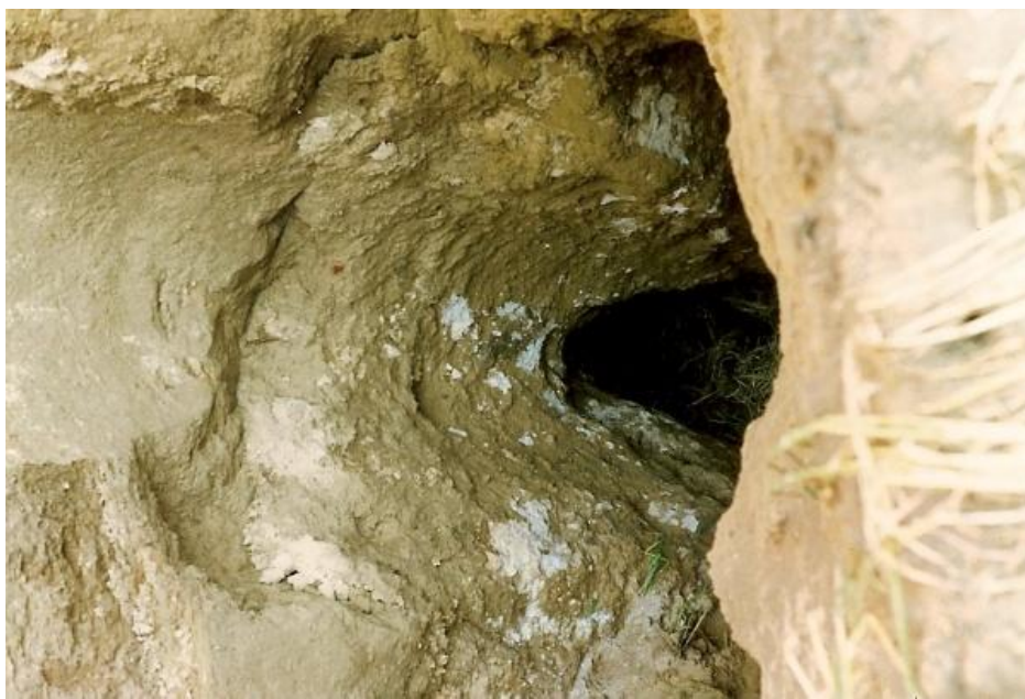
Figure 2 Trou apparu en 2000, ruelle Forie à Hodeige à 1.200 mètres des éoliennes 5 et 6