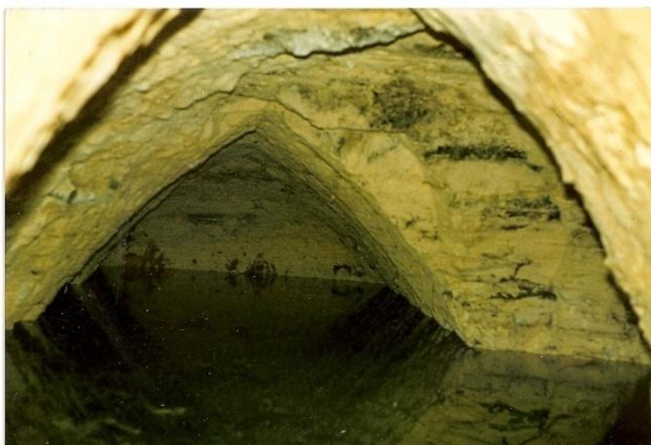
Figure 3 Le trou de la figure 2 a permis mettre cette galerie à jour.